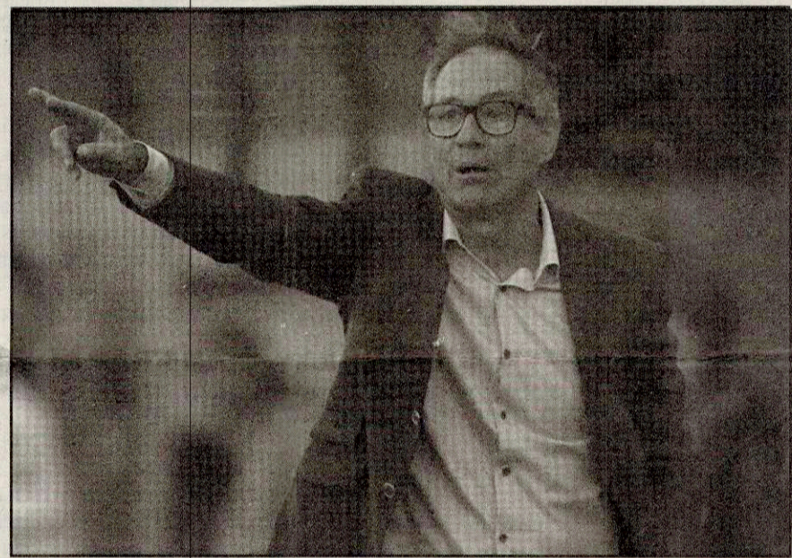
Novo treinador do Santos comandava Universidad Católica, na qual foi campeão chileno