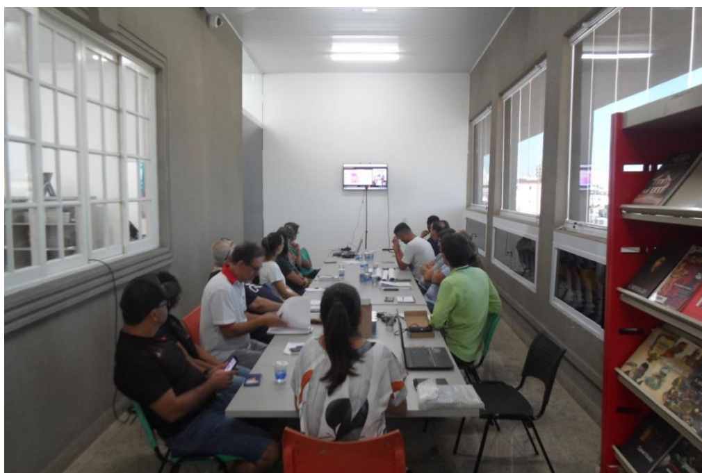
Imagem 01: Reunião do Comtur de Praia Grande