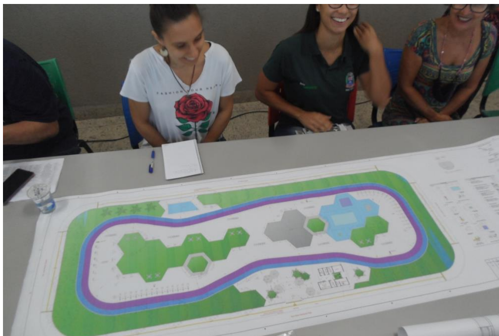
Imagem 03: Apresentação do Projeto do Parque Maracanã