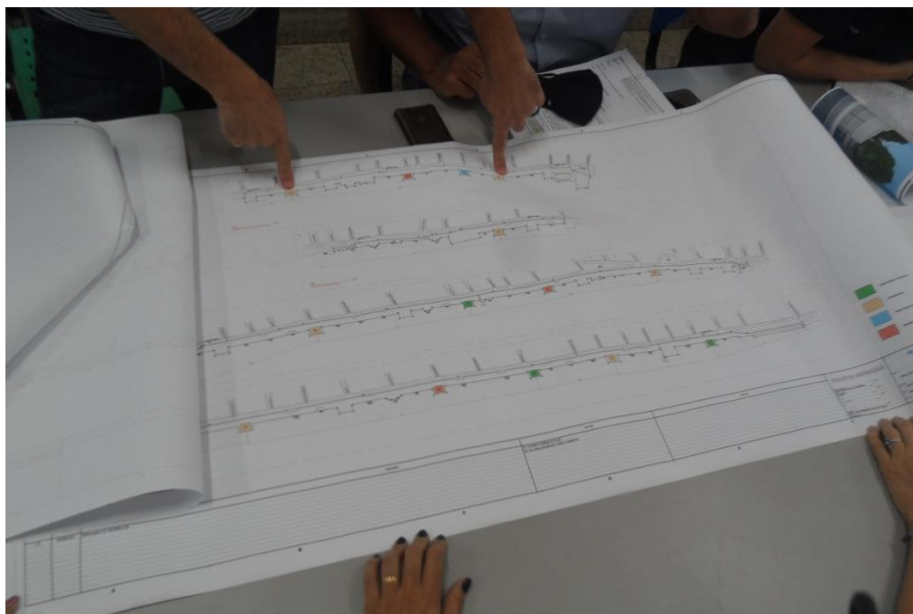
Imagem 04: Apresentação do Projeto dos Banheiros Públicos de Praia Grande