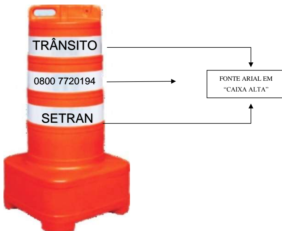
FIGURA 1 – IMAGEM DE REFERÊNCIA DO SUPER CONE

Todo material deverá ser identificado de forma legível e indelével com, no mínimo, nome ou marca do fabricante.